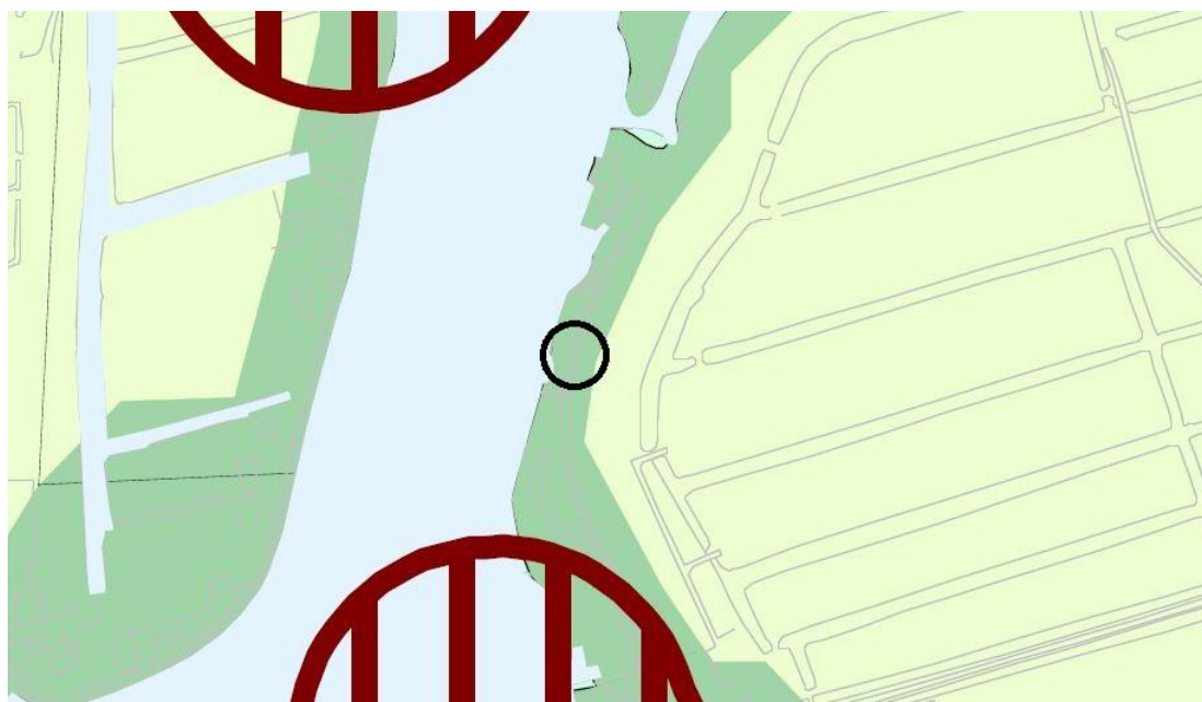
Archeologische beleidsadvieskaart gemeente Kaag en Braassem (plangebied: zwart omcirkeld)

Navolgende afbeelding toont een uitsnede uit de archeologische beleidsadvieskaart van de gemeente Kaag en Braassem.