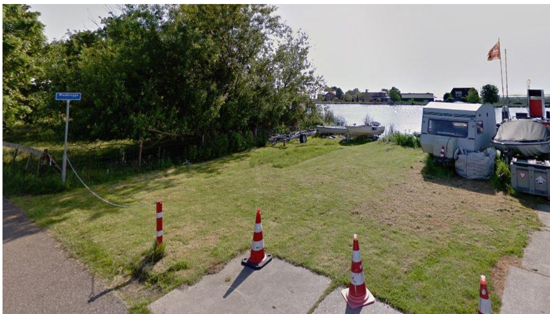
Huidige situatie plangebied

De gronden aan de oostzijde van het plangebied zijn in gebruik voor agrarische doeleinden. De volgende afbeelding toont de huidige situatie.