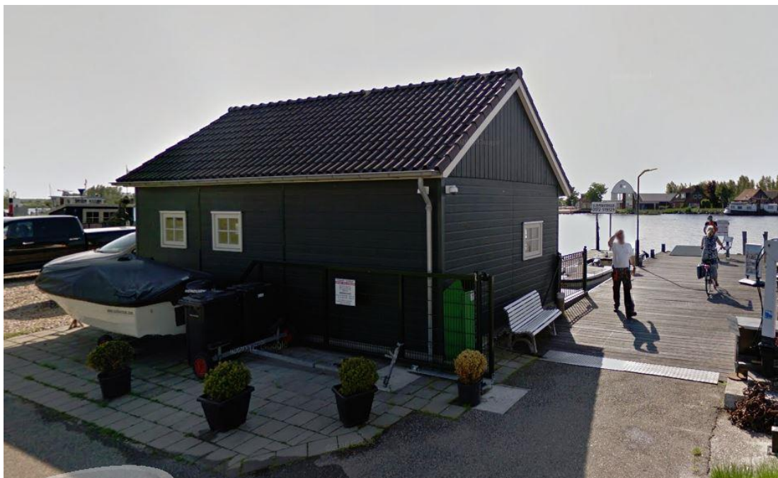
Bestaande schuur behorende bij de veerdienst

Navolgende afbeelding toont bestaande schuur van de veerdienst.