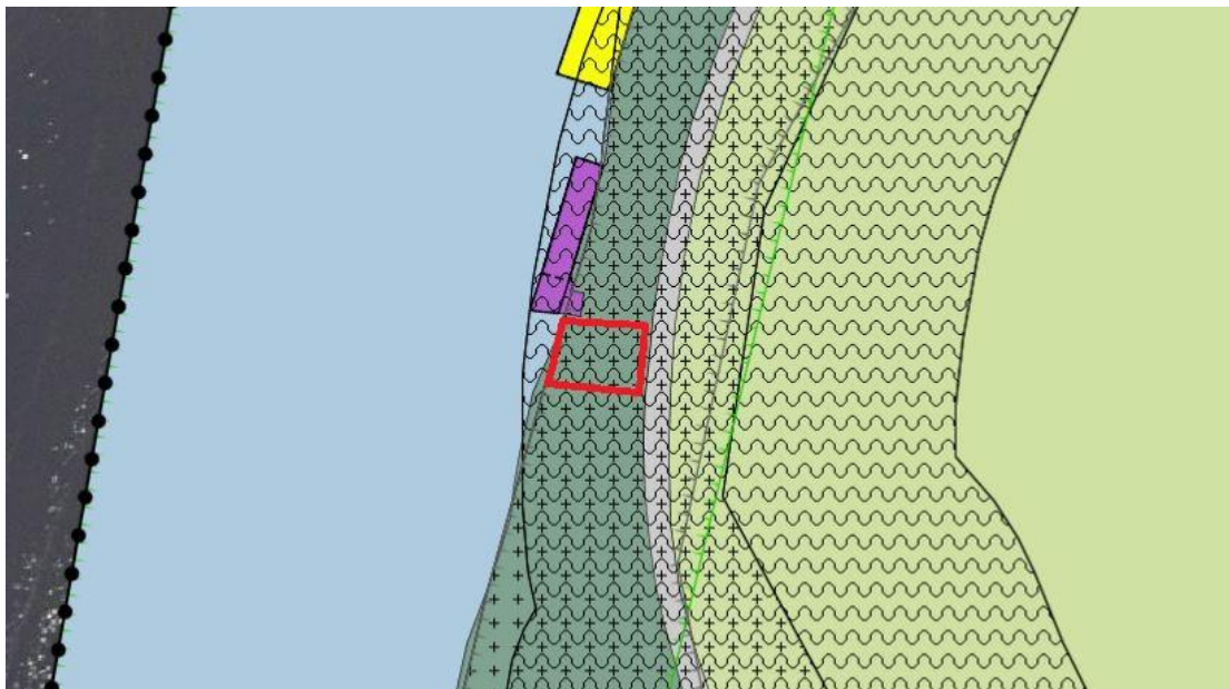
Uitsnede geldend bestemmingsplan 'Buitengebied Oost' (plangebied rode omkadering)

De gronden vallen binnen het bestemmingsplan 'Buitengebied Oost'. Dit bestemmingsplan is vastgesteld op 31 mei 2018 door de raad van de gemeente Kaag en Braassem. De volgende afbeelding toont een uitsnede van de verbeelding van het geldende bestemmingsplan 'Buitengebied Oost'.