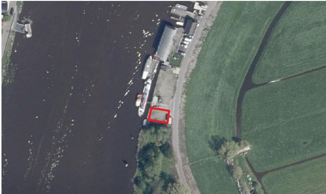
Globale begrenzing plangebied (rode omkadering)

Het plangebied is gelegen op de dijk aan het Paddegat, welke een verbinding is tussen de Wijde Aa met het Braassemermeer. Aan de overzijde van het Paddegat ten noorden van het plangebied ligt de kern Roelofarendsveen, ten zuiden van het plangebied ligt de kern Woubrugge en aan de oostzijde van het plangebied bevinden zich agrarische gronden.