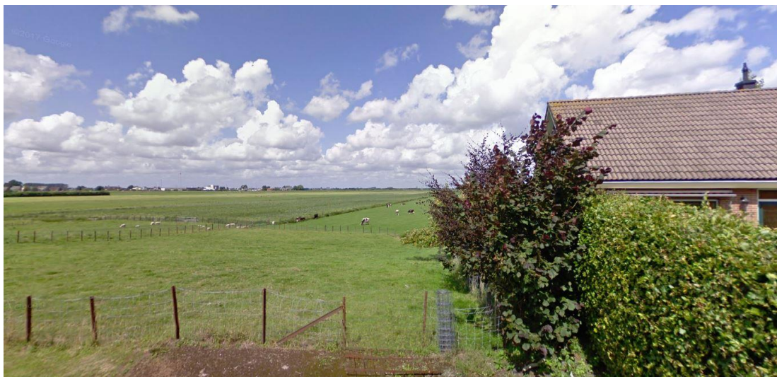
Planlocatie gezien vanaf Vriezekoop Noord met aan de rechterzijde de woning aan de Vriezekoop Noord 4b

Navolgende afbeeldingen tonen de huidige situatie van het plangebied en de woning met tuin aan de Vriezekoop Noord 4b.