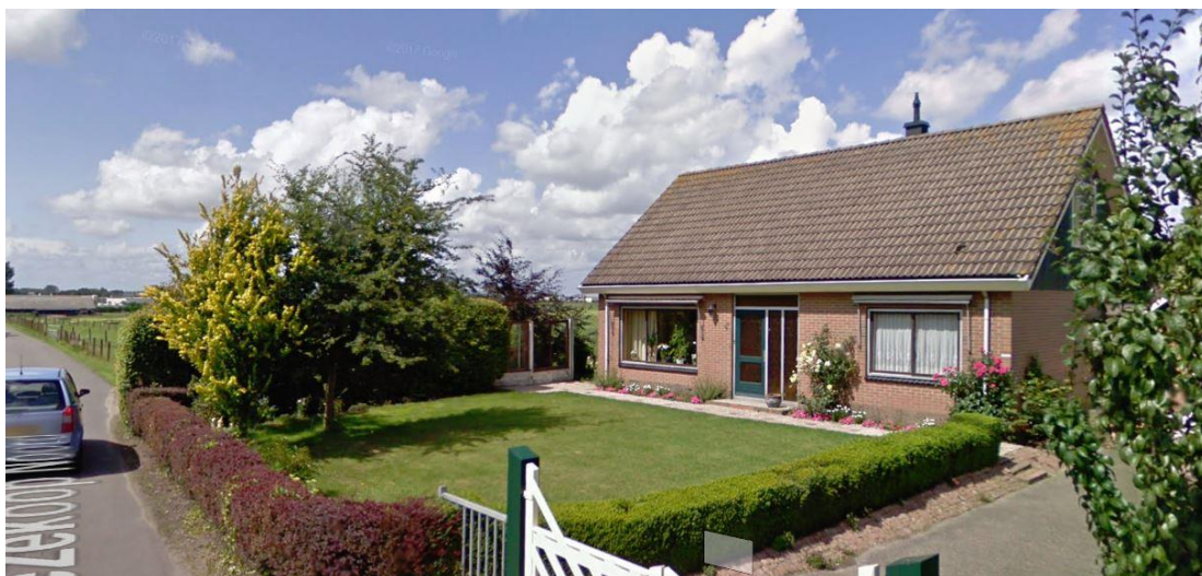
Huidige situatie woning en tuin Vriezekoop Noord 4b