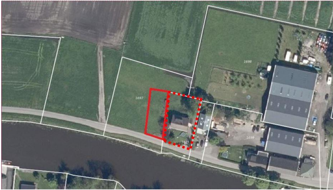
Globale begrenzing plangebied

Voorgaande afbeelding toont de planlocatie. Het rood omlijnde gebied betreft de grond die omgezet dient te worden naar een woonbestemming. Deze wordt betrokken bij het gebied dat reeds bestemd is voor wonen (omkaderd met rode stippellijn).