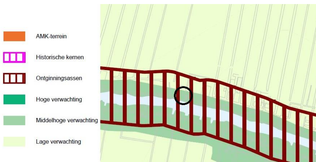
Uitsnede archeologische beleidsadvieskaart (plangebied zwart omcirkeld)

Navolgende afbeelding toont een uitsnede van de archeologische beleidsadvieskaart van Kaag en Braassem.