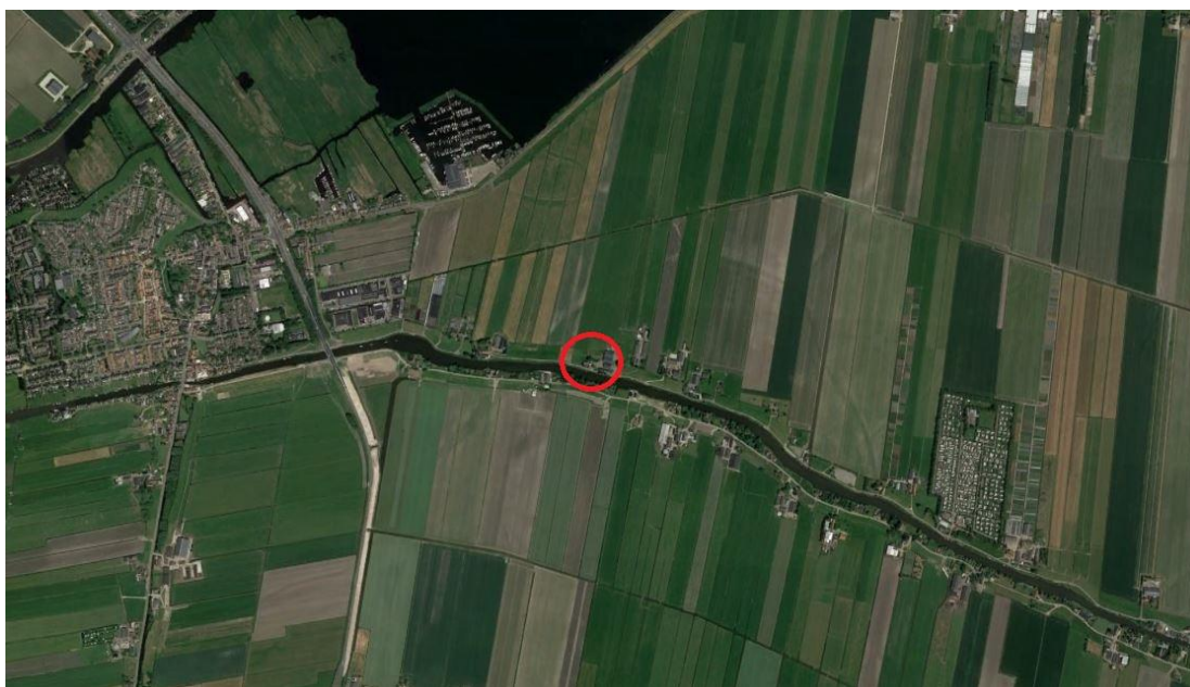
Globale ligging plangebied (rood omcirkeld)

De navolgende afbeeldingen geven de globale ligging en de globale begrenzing van het plangebied weer.