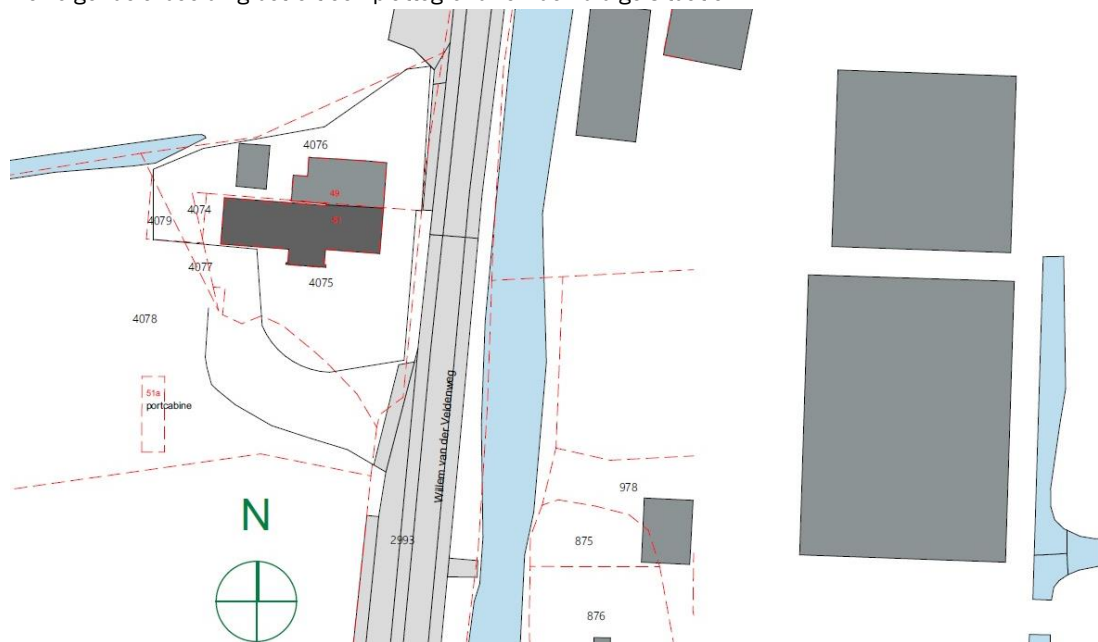
Plattegrond huidige situatie

De volgende afbeelding betreft een plattegrond van de huidige situatie.