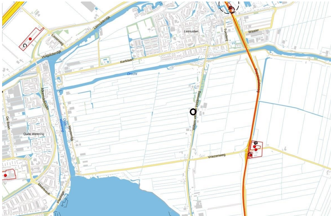
Uitsnede risicokaart (globale ligging plangebied: zwarte cirkel)

Uit raadpleging van de risicokaart blijkt dat er in de directe omgeving van de locatie geen risicovolle inrichtingen, transportroutes voor gevaarlijke stoffen of buisleidingen aanwezig zijn. Er worden met het plan geen risico's gecreëerd of vergroot. Het aspect externe veiligheid vormt daarom geen belemmering voor de beoogde ontwikkeling.