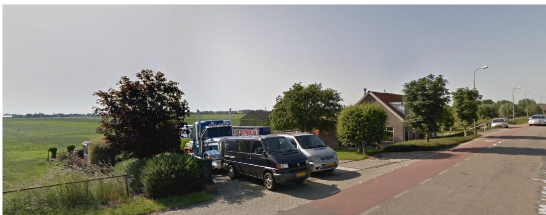
Aanzicht planlocatie vanuit zuidoostelijke richting

Het plangebied ligt aan een dijk. De dijk is deels bij de tuin gevoegd en als zodanig ingericht. De gronden achter het plangebied zijn in gebruik voor agrarische doeleinden. De volgende afbeelding geeft een impressie van de planlocatie, vanaf de zuidzijde van de Willem van der Veldenweg.