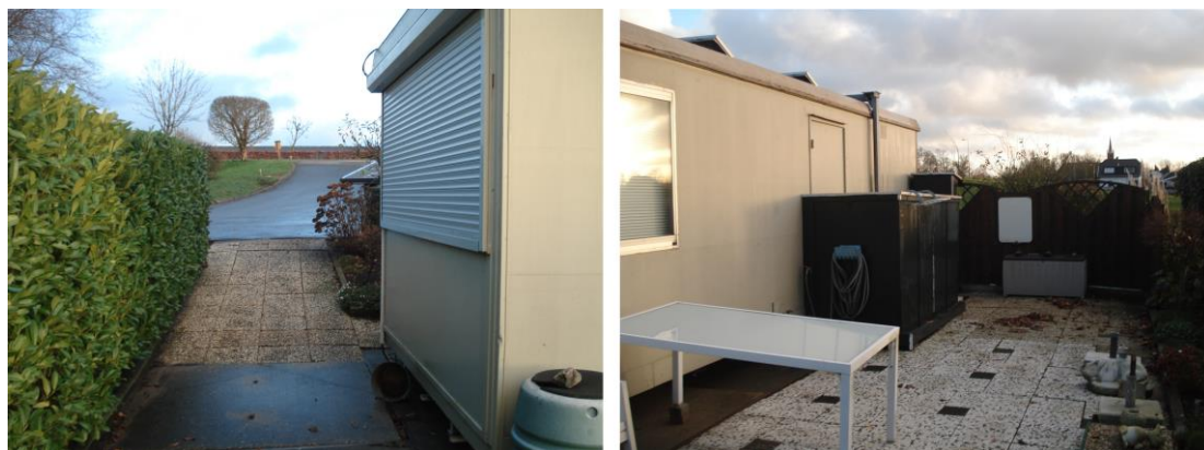
Portacabin ter plaatse van de beoogde berging / stalling

Teneinde de berging / stalling te kunnen realiseren wordt de bestaande stacaravan, in de vorm van een portacabin, van het perceel verwijderd. De portacabin (weergeven op navolgende afbeelding) is een verplaatsbare unit van gestandaardiseerde afmetingen. Het dak is plat uitgevoerd en de wanden zijn van kunststof. Er bevinden zich geen spouwmuren of andere kieren. Daarmee is de huidige bebouwing niet geschikt als leefgebied voor vleermuizen of andere beschermde soorten.