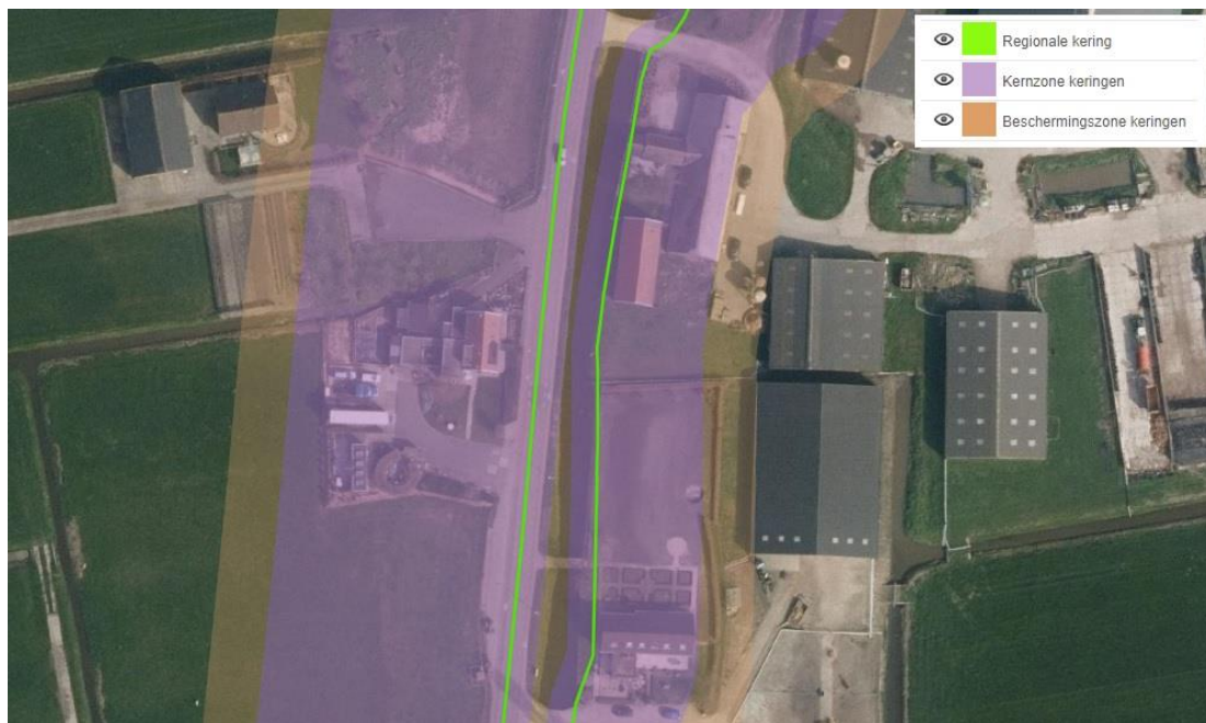
Uitsnede legger waterkeringen

De volgende afbeelding toont een uitsnede van de legger van het hoogheemraadschap van Rijnland.