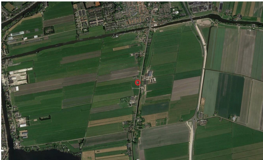
Globale ligging plangebied (rood omcirkeld)

De navolgende afbeeldingen geven de globale ligging en de globale begrenzing van het plangebied weer.