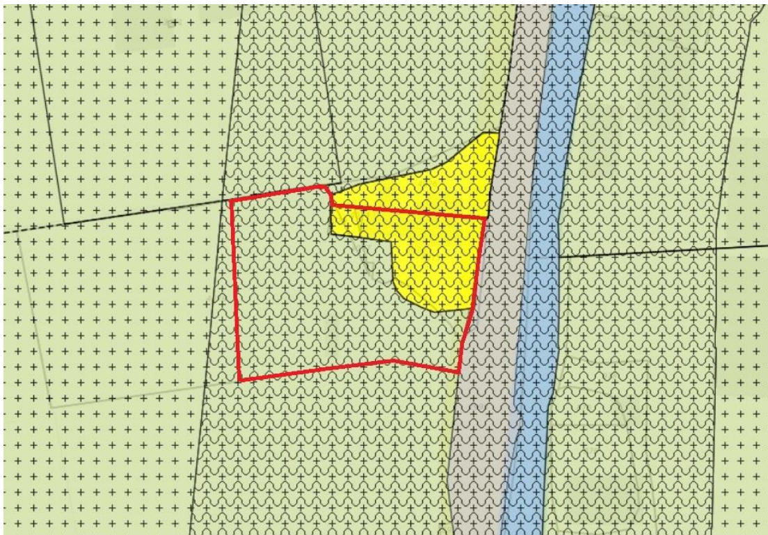
Uitsnede geldend bestemmingsplan 'Buitengebied Oost' (globale begrenzing plangebied is rood omlijnd)

De gronden vallen binnen het bestemmingsplan 'Buitengebied Oost'. Dit bestemmingsplan is vastgesteld op 31 mei 2018 door de raad van de gemeente Kaag en Braassem. De volgende afbeelding toont een uitsnede van de verbeelding van het geldende bestemmingsplan 'Buitengebied Oost'.