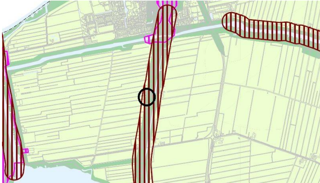
Uitsnede archeologische beleidsadvieskaart (plangebied: zwart omcirkeld)

Navolgende afbeelding toont een uitsnede van de archeologische beleidsadvieskaart van de gemeente Kaag en Braassem.