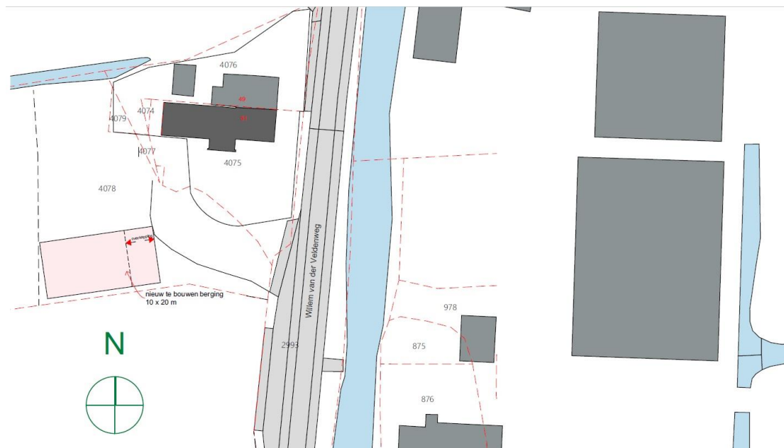
Impressie beoogde situatie

Navolgende afbeeldingen tonen de beoogde situatie.