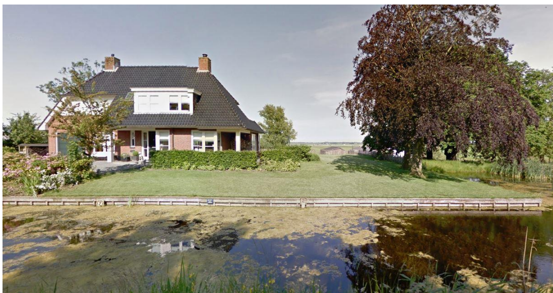
Voorraanzicht planlocatie

Ten noordwesten van het plangebied, aan de overzijde van de Herenweg, bevindt zich een jachthaven. Aan de noordoostzijde is een grote loods gesitueerd welke dient als stalling voor jachten. Ten zuiden van het plangebied zijn in de lintbebouwing voornamelijk woningen gesitueerd. De gronden ten oosten van het plangebied, achter de lintbebouwing, zijn in gebruik voor agrarische doeleinden.