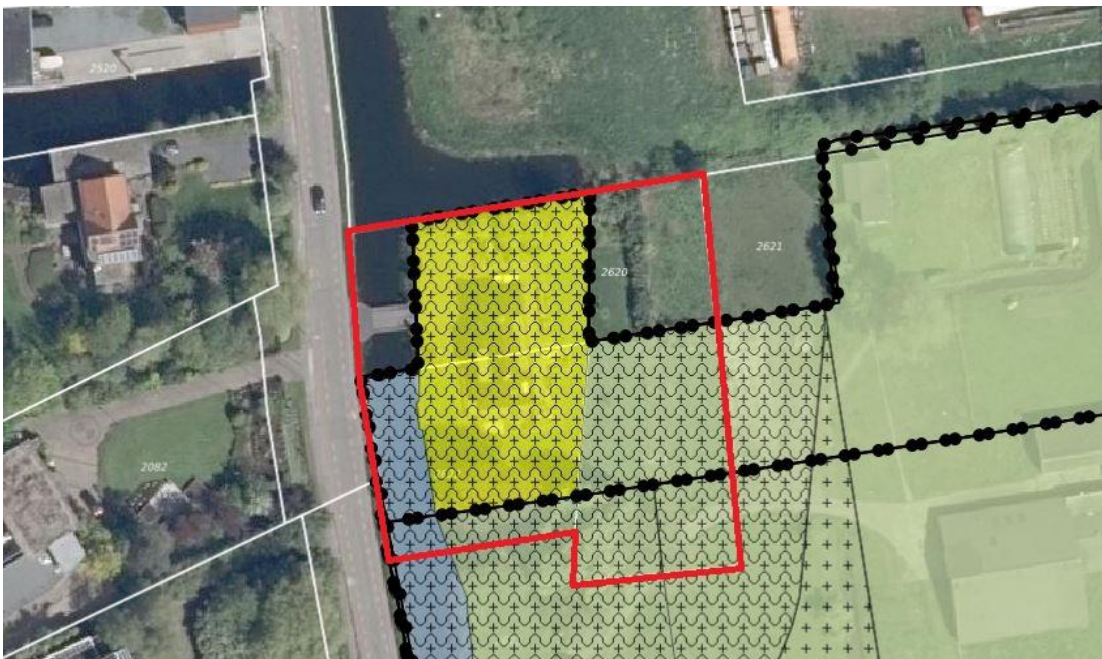
Verbeelding geldend bestemmingsplan 'Buitengebied Oost' (plangebied is rood omlijnd)

De navolgende afbeelding toont een uitsnede van de verbeelding van het geldende bestemmingsplan 'Buitengebied Oost'.