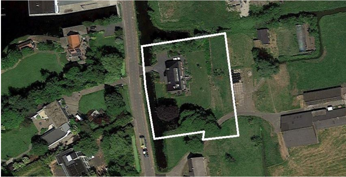
Globale begrenzing plangebied (witte omlijning, bron: Google Earth)