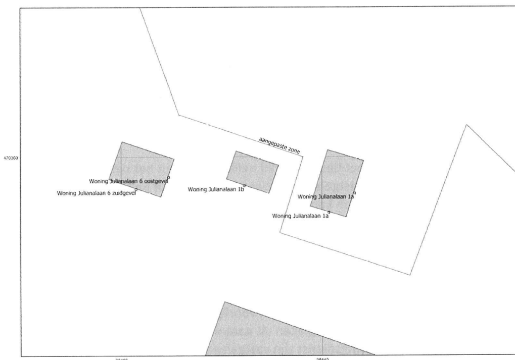
Figuur 1 Ligging van de woning Julianalaan 1b.

In het geluidrapport 1 is de geluidsbelasting vanwege van Van Lent ter plaatse van de gevels van de woningen 2 inzichtelijk gemaakt. Uit het akoestisch rapport blijkt dat de voorkeurwaarde van 50 dB(A) ter plaatse van de Julianalaan 1b wordt overschreden. De geluidsbelasting ten gevolge van de inrichting zal 51 dB(A) bedragen. Deze geluidsbelasting voldoet aan de maximale ontheffingswaarde van de Wet geluidhinder van 60 dB(A). De positie van de woning is in figuur 1 aangegeven.